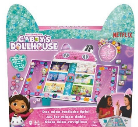
Let`s Party: Gabby`s Dollhouse- Das miau-tastische Spiel

Auf der beliebten Vorschulserie „Gabby`s Dollhouse“ basiert dieses Puppenhausspiel , in dem die einzelnen Räume von Gabbys bezauberndem Katzenpuppenhaus für eine miau-tastische Party dekoriert werden müssen. Highlight für kleine Katzenfans ab vier Jahren: Jeder darf zu Spielbeginn einen niedlichen Haarreif mit Katzenohren aufsetzen. Während der Partyvorbereitung, welche die Gabby-Fans quer durch das ganze Puppenhaus führt, können Accessoires für das perfekte Partyoutfit gesammelt und auf den Haarreif aufgesteckt werden. In der Mitte des Spielplanes befindet sich ein Aufzug, mit dem die Räume auf den verschiedenen Etagen erreicht werden können. Entsprechend der gewürfelten Zahlen bewegen sich die fleißigen Kätzchen durch das Puppenhaus und dekorieren jeden Raum, zu dem sie die entsprechende Raumkarte besitzen. Das Ziel des Spiels ist erreicht, wenn alle Zimmer von Gabby`s Dollhouse für die Party hergerichtet worden sind. Das Beste daran: Alle, die dazu beigetragen haben, dürfen sich am Ende als Gewinner fühlen, denn: Die Party kann steigen! Wer es zudem geschafft hat, alle Steckplätze an seinem Haarreif mit einem Accessoire zu verzieren, bekommt einen exklusiven Herzanstecker.