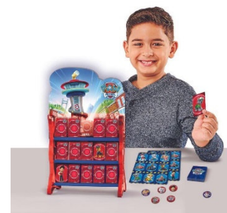
Die XXL PAW Patrol HQ Spielesammlung!

Die wollen doch nur spielen! Die Hundehelden der PAW Patrol laden mit der umfangreichen Spielesammlung von Spin Master Games ab Herbst zum lustigen Spielenachmittag ein! Acht beliebte Klassiker im Original PAW Patrol Design unterhalten kleine Fans der Fellfreunde, wenn der Fernseher oder das Tablet einmal aus bleiben sollen. Mit den abwechslungsreichen Karten-, Memo-